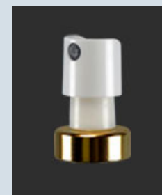
18mm & 20mm Kapsel