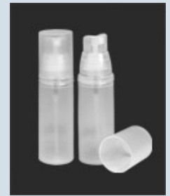
ErgoPack als Sprühpumpe