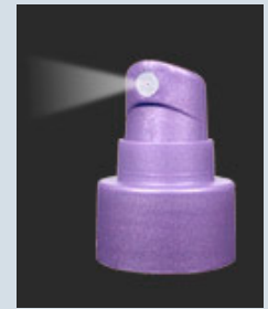
Cardinal als Spühpumpen